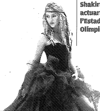
Shakira actuarà a l'Estadi Olímpic

El 29 de maig la cantant tornarà a actuar a Barcelona, mig any després d'haver-ho fet